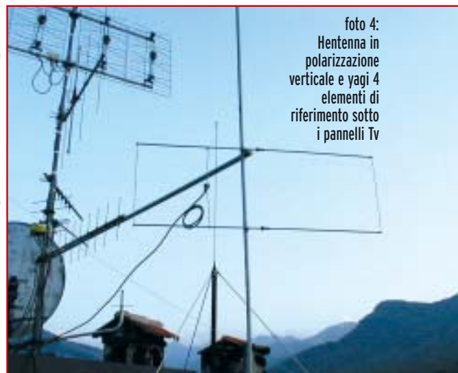
foto 4: Hentenna in polarizzazione verticale e yagi 4 elementi di riferimento sotto i pannelli TV