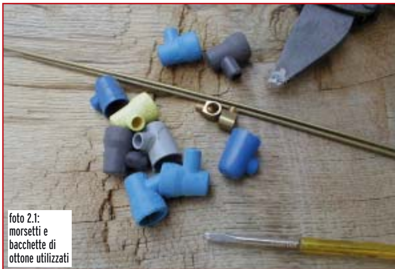
foto 2.1: morsetti e bacchette di ottone utilizzati